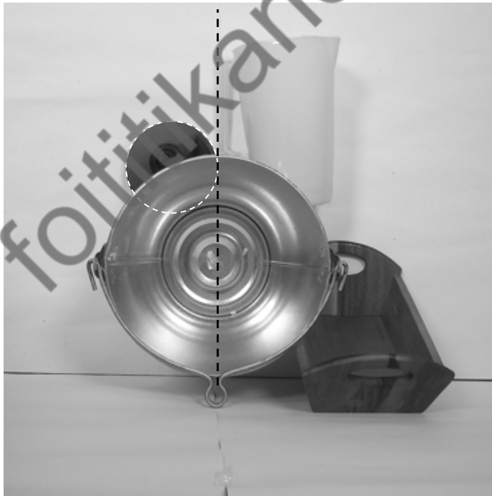
δεύτερη φωτογραφία: κάτοψη