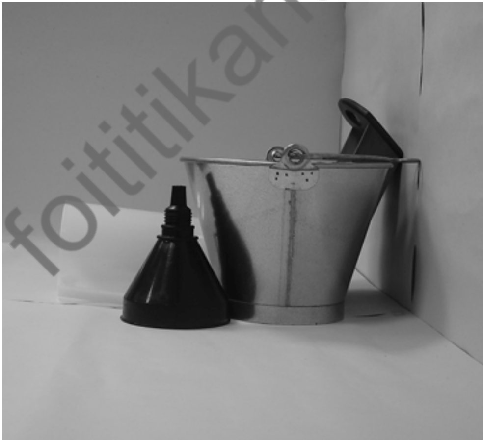
τέταρτη φωτογραφία: πλάγια όψη