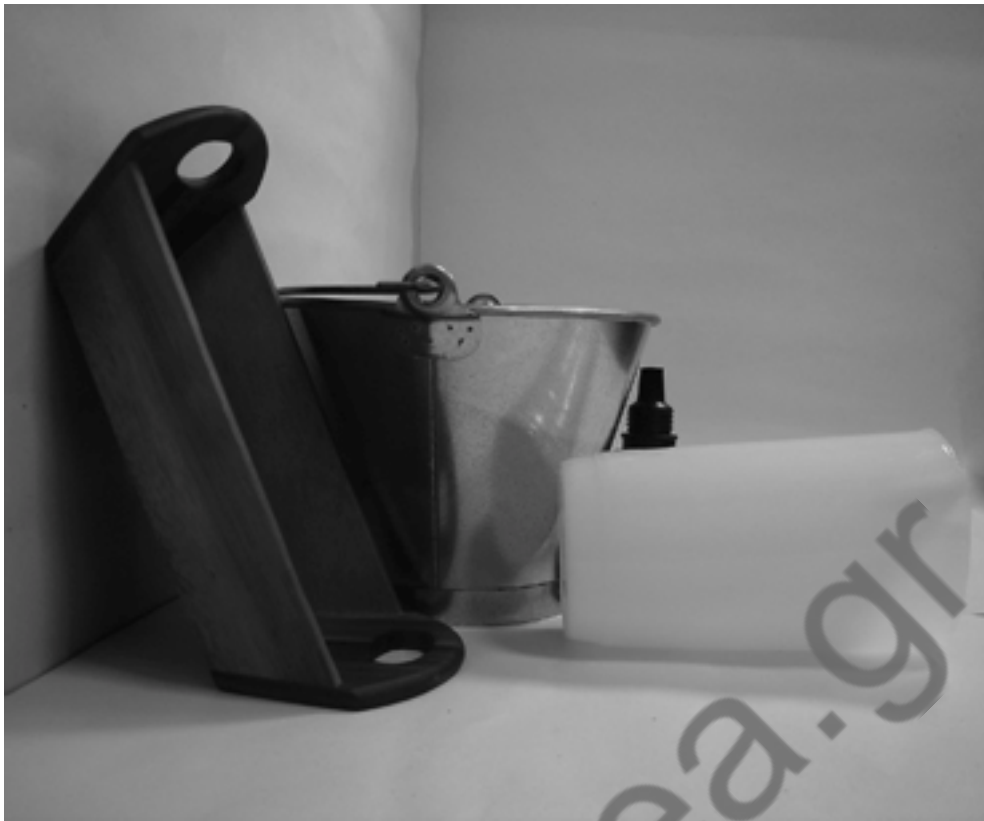
τρίτη φωτογραφία: πλάγια όψη